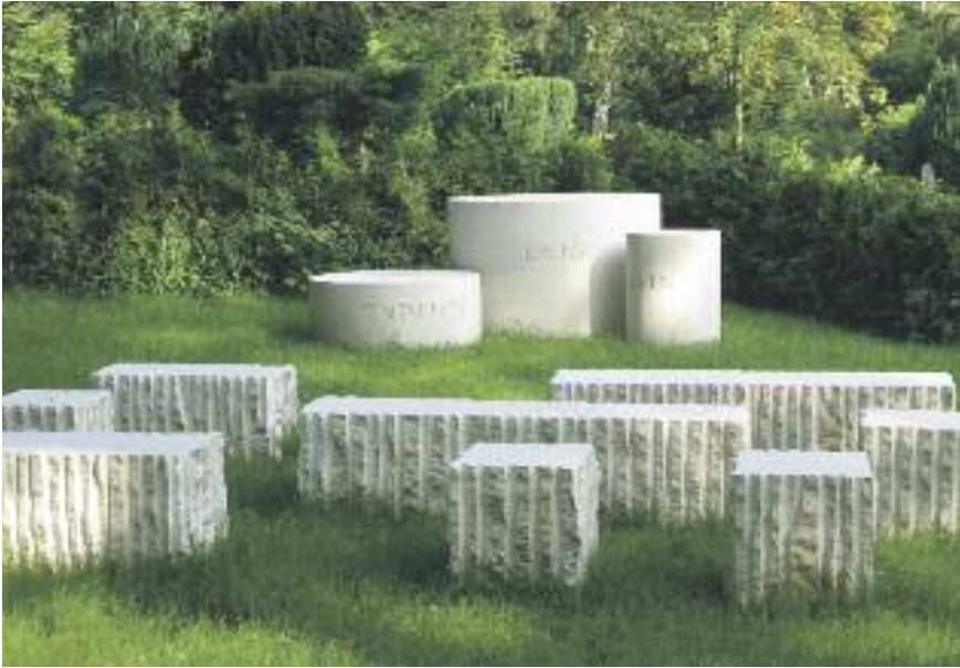
Steine für die Ewigkeit: Der Außenaltar mit den eingemeißelten Worten „Endlich“, „Ewig“ und „Sein“